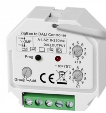
ZIGBEE DALI DT6 - BEGA-SR2411ZG-DIM