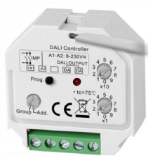
RT DALI DT6 - BEGA-SR2411RF-DIM