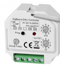
ZIGBEE DALI DT8 - TNW-SR2411ZG-CCT