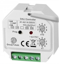
RTN-DALI DT8 - TNW-SR2411RF-CCT