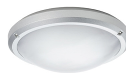
Couleur gris RAL9006