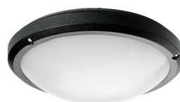
Couleur noir RAL9017